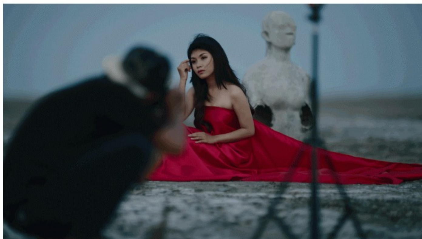
"Injustiça" é o grande vencedor da 25ª edição do CineEco

No panorama internacional de longas-metragens mereceram ainda destaque documentários sobre temáticas transversais e atuais sobre a ação do Homem no meio-ambiente. O "Grande Prémio Antropologia Ambiental – Liberty Seguros" foi conquistado por Reator Perdido (Lost Reator) , documentário alemão sobre um grupo de pessoas que vivem numa dimensão de tempo pós-Chernobyl paredes-meias com uma Central de Energia Nuclear que nunca chegou a funcionar.