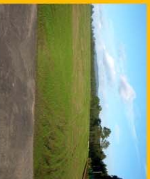
Aterro: Aterro de Landos (Povoia de Varzim)

A redeção de aterros e as medidas positivas de recuperação ambiental do local visa contribuir para a eliminação dos riscos ambientais, de poluição das águas no solo e da degradação da paisagem.