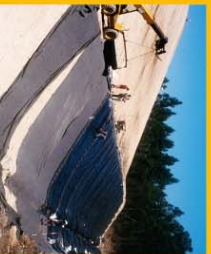
Aterro: Aterro de Vila do Conde

Qualquer solução a adoptar neste âmbito deverá considerar a estabilidade e estabilização da massa de resíduos, o controlo e tratamento do comórbio e tratamento dos lixiviados, o controlo e tratamento do biogás e a adopção paisagística e estrutural futura do local. Assim, é fundamental criar uma estrutura de lixiviados, considerando as condições ambientais, a utilização do solo e a qualidade dos recursos, evitando de forma de drenagem, captação e tratamento da água, evitando de forma de drenagem e captação de lixiviados, etc.