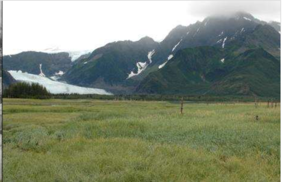
Pedersen Glaciar, Alasca Verão de 2005