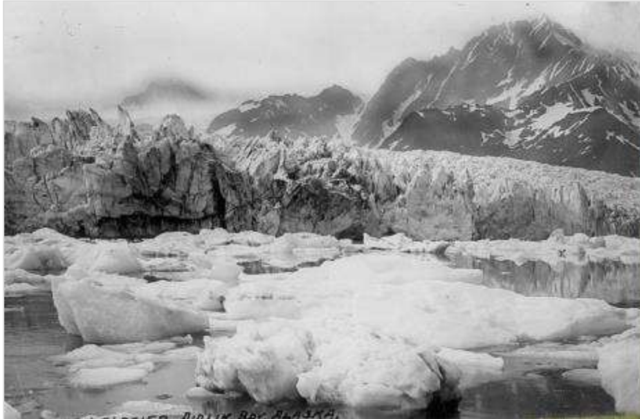
Pedersen Glaciar, Alasca Verão de 1915