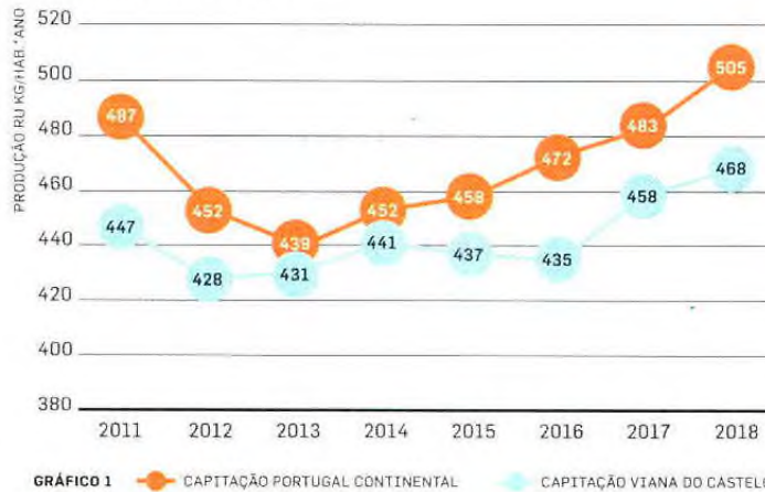
PRODUÇÃO TOTAL DE RU

Para além disso, no ano passado cada vianense separou 58 kg de resíduos recicláveis de embalagens, mais 18 kg em relação ao universo da população abrangida pelos municípios do Sistema de Gestão de Resíduos Urbanos (SGRU) concessionado à Resulima, S.A. (Viana do Castelo, Arcos de Valdevez, Barcelos, Esposende, Ponte da Barca e Ponte de Lima). Desta forma, Viana do Castelo ultrapassou tanto a meta nacional de retoma seletiva de resíduos recicláveis, como a meta imputada à Resulima, S.A., contribuindo para potenciar os efeitos positivos da diminuição da quantidade de resíduos em aterro (ver gráfico 1).