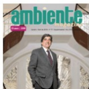
Janeiro 018 | nº77 (3023 descarregamentos)