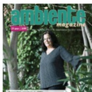
Maio 018 | nº78 (3099 descarregamentos)