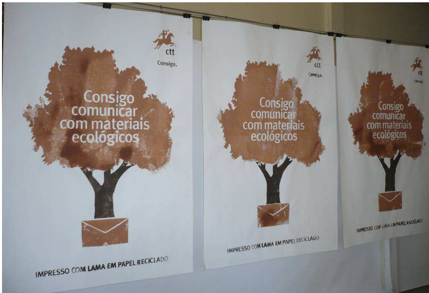
Mupis especiais de lama